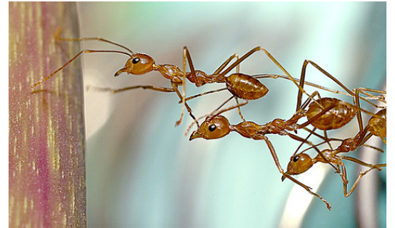
Gemeinsam erreichen wir das Ziel!

Wir sind ein kompetentes, flexibles, kleines Team von 4 Personen mit den Kernkompetenzen, welches wir jedoch rasch erweitern können um Spitzenzeiten abdecken zu können.